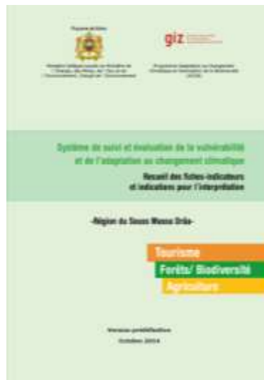
Recueil des indicateurs