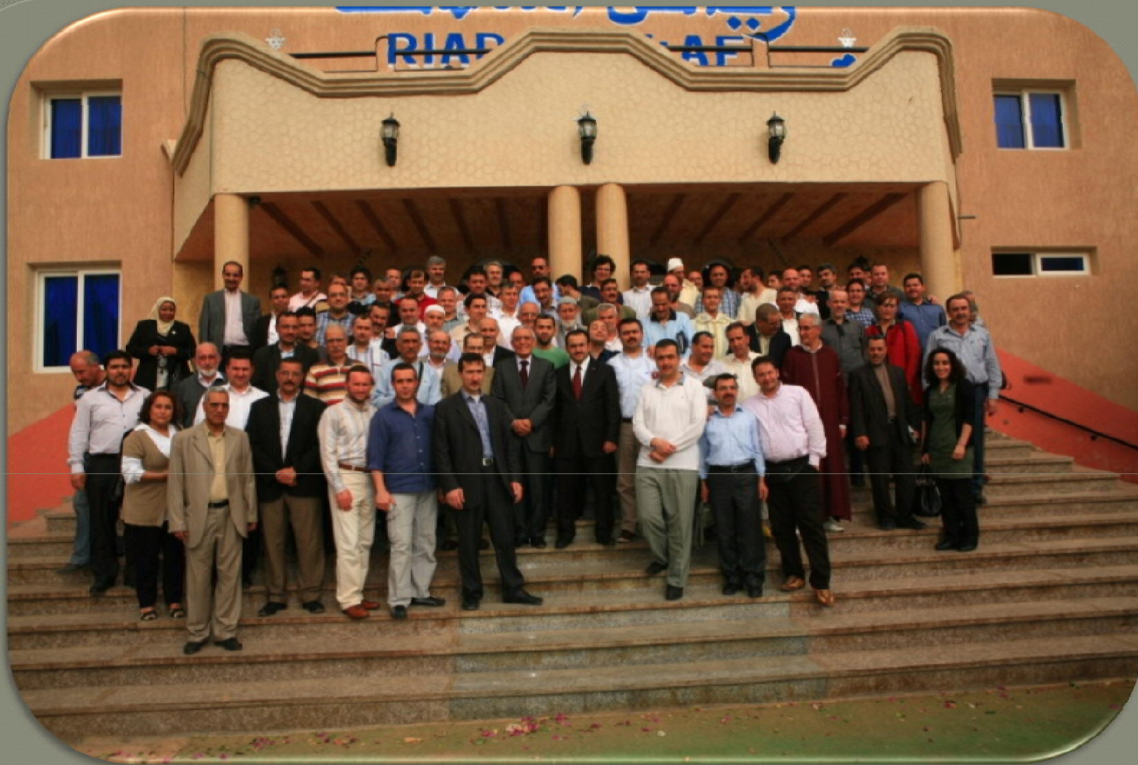
زيارة وفد من رجال الأعمال والمستثمرين الأتراك لمدينة تيزنيت 23 مارس 2012